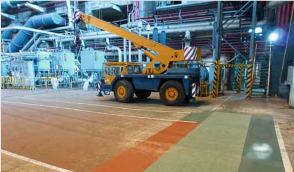
Faserverbundabdeckungen in D400