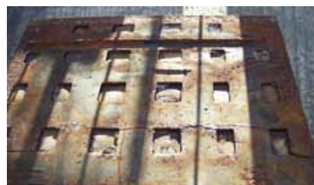
Oberseite und Unterseite der alten Beton-Stahl-Abdeckung